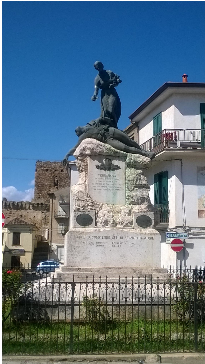
Monumento ai caduti della I guerra mondiale di Terranova da Sibari, foto Saverio Di Renzo, 11/09/2014.

Terranova da Sibari (CS) ove si era recato per lavoro. Incuriosito, giorni dopo, si è recato in Comune per chiedere se esistesse qualche documento attestante il nome dell'autore del monumento. In tale occasione fotografa una targhetta commemorativa della inaugurazione della piazza dei caduti a Michele Bianchi, mostratagli, in cui è riportato il nome dello scultore Torquato Tamagnini devoto alla città di Terranova da Sibari.