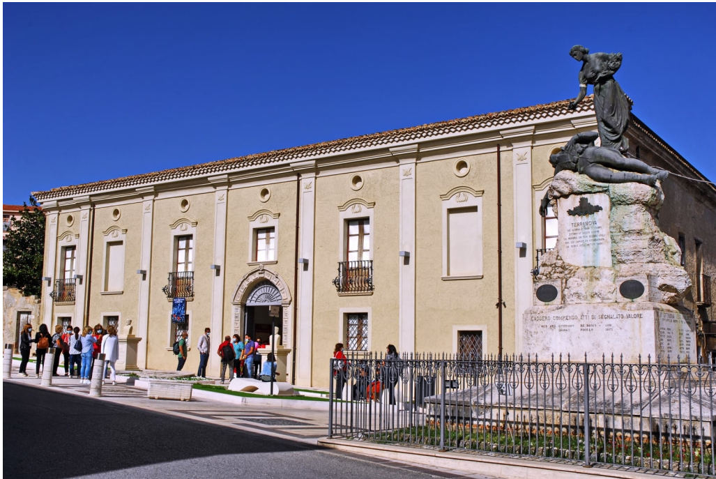
Museo Civico di Terranova da Sibari.

La foto seguente è stata pubblicata in Facebook il 7 ottobre 2020 dall'associazione “ Le Città Visibili ”.