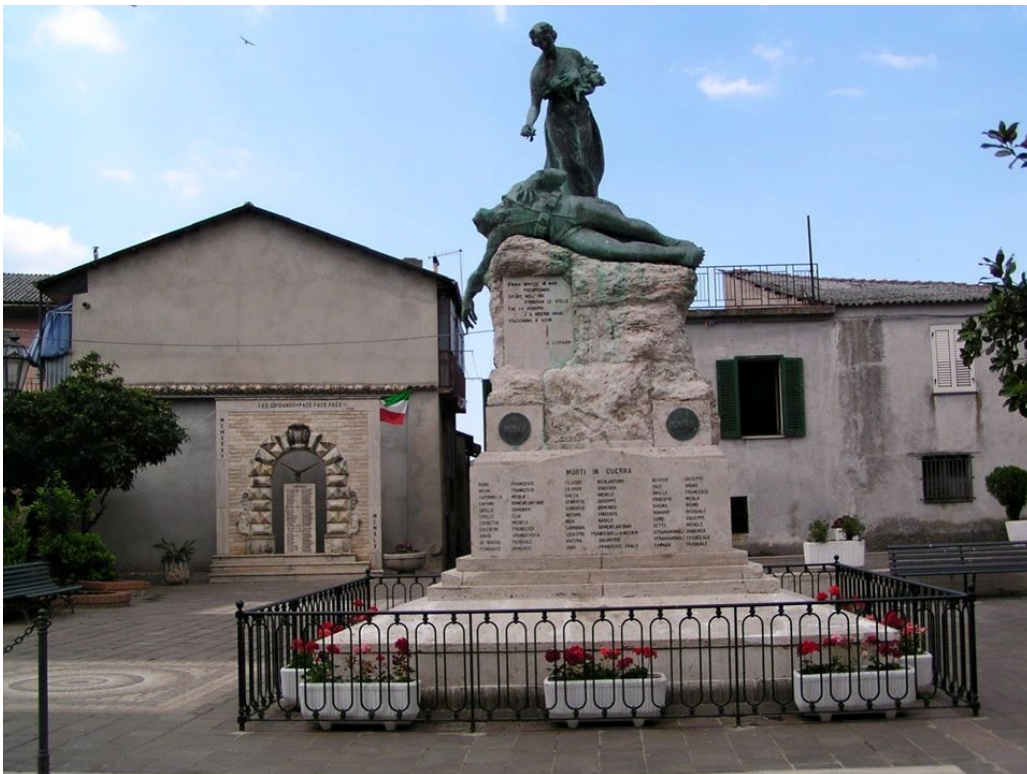
Piazza dei caduti Dasà, Monumento della I guerra mondiale.

La foto seguente, pubblicata nel gruppo Facebook Dasà nel cuore , è del 24 maggio 2015.