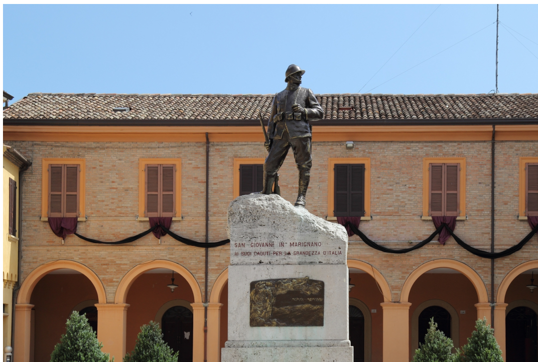
Monumento ai caduti di San Giovanni in Marignano