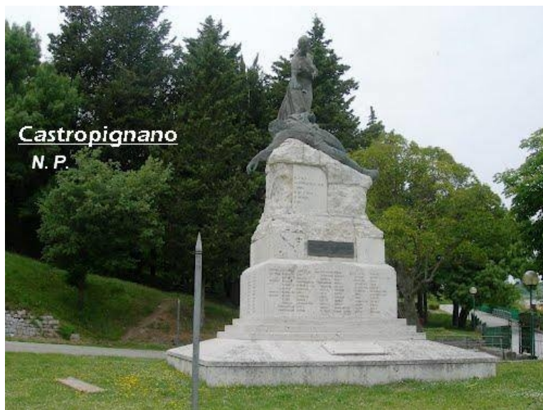
Monumento ai caduti della prima guerra mondiale Castropignano.