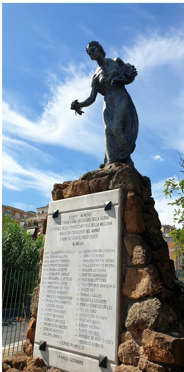
Monumento ai caduti della Parrocchietta (Roma)

«Il Monumento ai Caduti della Parrocchietta è un'opera memoriale a ricordo dei soldati e ufficiali del quartiere Parrocchietta ( e Magliana di Roma ) che morirono durante la Prima guerra mondiale.